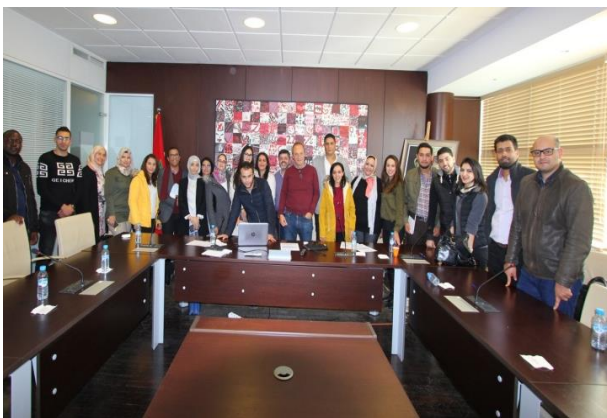
UIR – Rabat