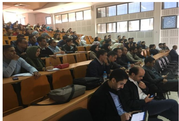
UIZ - Agadair

Les témoignages des chefs d'entreprises et des étudiants sur les problèmes de l'employabilité et surtout sur le problème de la communication entre lauréats et employeurs ont suscité un vif intérêt dans l'assistance, surtout que cette question reste la plus épineuse du système éducatif marocain et même mondial.