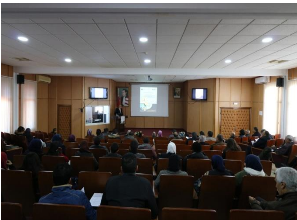
USMBA – Fès