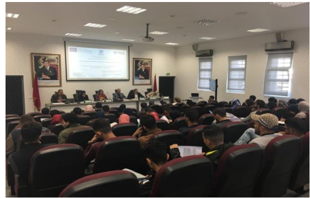
UAE - Tanger