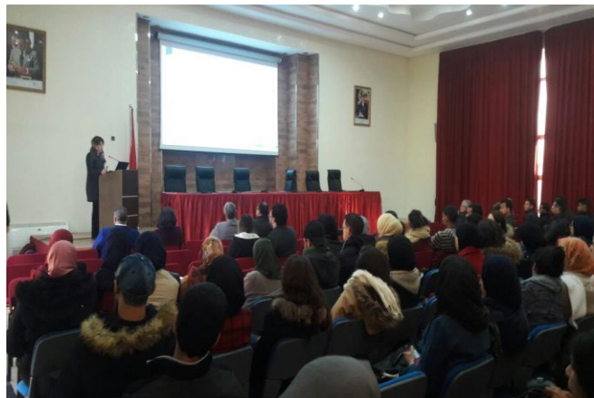
UIT - Kénitra

Le développement de partenariats efficaces Entreprises – Universités permettra d'une part à l'université d'accomplir sa mission en tant que pourvoyeur des ressources humaines et à l'entreprise d'atteindre ses objectifs en tant qu'exploiteur des connaissances et des compétences (meilleure compétitivité dans le marché,...).