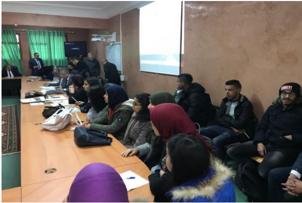
UMI – Oujda